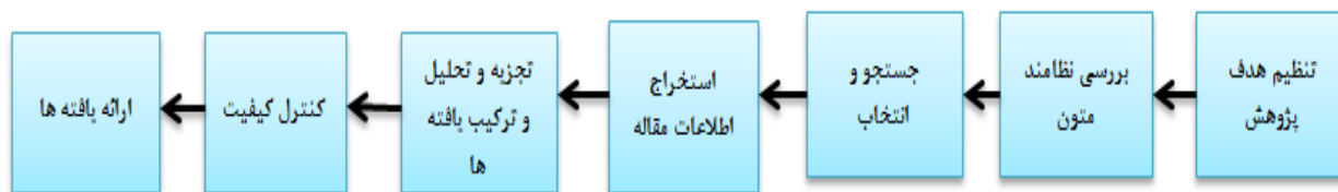
شکل ۱: گام‌های سنتز پژوهی بر اساس روش هفت مرحله‌ای (سندلوسکی و باروسو، ۲۰۰۷)

برای دستیابی به هدف پژوهش از روش سنتز پژوهی، مطابق با الگوی سندلوسکی و باروس استفاده شد که خلاصه این مراحل در شکل ۱ نشان داده شده است.