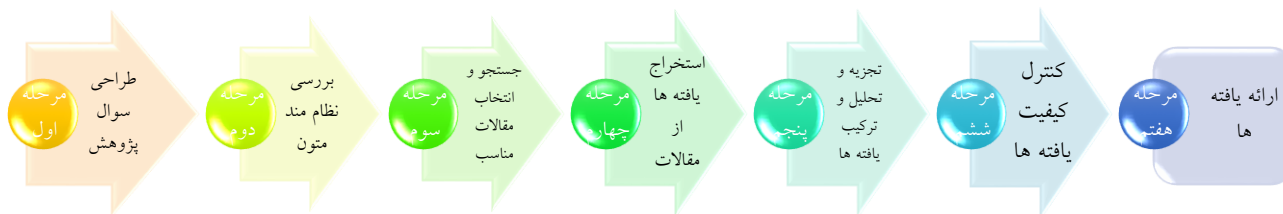
شکل (۱): مراحل هفت‌گانه پژوهش

پژوهش منتشر شده (مقاله، پایان نامه، رساله) در پایگاه‌های اطلاعاتی علمی معتبر داخلی و خارجی بود که بر اساس کلیدواژه ممیزی مدیریت منابع انسانی به منظور دستیابی به نمونه‌ای نظری که اشباع نظری را موجب شود، پیمایش شدند. برای جست‌وجوی کلیدواژه‌ها محدوده زمانی (۲۰۰۶-۲۰۲۳) ۱۳۸۵ الی ۱۴۰۲ در نظر گرفته شد. در زمینه نمونه‌گیری، ۳۴ مطالعه مرتبط با استفاده از رویکرد هدفمند انتخاب شد. مبنای روایی این پژوهش نظر متخصصان بوده است. برای سنجش پایایی در این پژوهش، از آزمون توافق کاپای کوهن استفاده شده است. شیوه انجام این پژوهش فراترکیب است. فراترکیب یکی از روش‌های فرا مطالعه است. فرا مطالعه یک تجزیه و تحلیل عمیق از کارهای پژوهشی انجام شده در یک حوزه خاص است. فرا مطالعه به چهار بخش فرا تحلیل (تحلیل کمی یافته‌های پژوهش‌های گذشته)، فراترکیب (تحلیل کیفی یافته‌های پژوهش‌های گذشته)، فراروش (تحلیل روش‌شناسی پژوهش‌های گذشته) و فرانظریه (تحلیل نظریه‌های پژوهش‌های گذشته) تقسیم می‌شود. فرامطالعه اگر به صورت کیفی بر روی مفاهیم مورد استفاده در مطالعات گذشته انجام گیرد به نام فراسنتز یا فراترکیب شناخته می‌شود. به طور کلی، فراترکیب نوعی مطالعه کیفی است که اطلاعات و یافته‌های مستخرج از مطالعات کیفی دیگر با موضوع مرتبط و مشابه را بررسی می‌کند. در این پژوهش از روش هفت مرحله‌ای فراترکیب سندلوسکی و باروسو (۲۰۰۷) به شرح شکل شماره (۱) استفاده شده است.