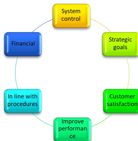
Figure 1: Audit dimensions of human resources management